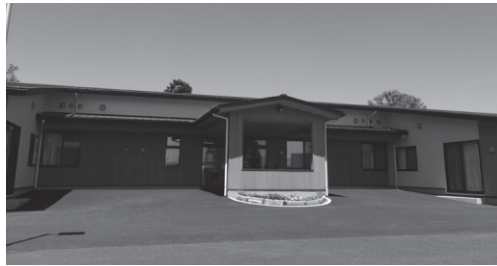
国立病院敷地内に開設し、密接な連携を図る

して、公募により開設された。今後は協力医療機関の訪問診療、同社運営の調剤薬局の薬剤師によるお薬相談などのサービスにより、入居者の健康管理を行なう。