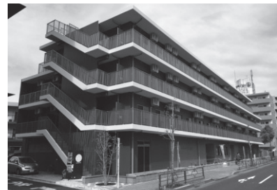
「バカラ」などのゲームを楽しみながら脳機能維持・向上が期待できる

アミューズメント型デイ併設住宅は同社では4カ所めとなり、今後年間1〜2棟のペースでの開設を目指す。現在は埼玉県ふじみ野市で開設の準備を進めている。